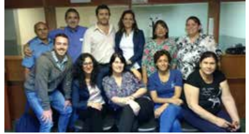
Equipo de trabajo del Juzgado de Paz de Garupá