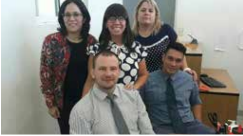
Equipo de Trabajo de las Fiscalía y Defensoría de 1ra. Instancia en lo Civil, Comercial, Laboral y de Familia de Jardín América