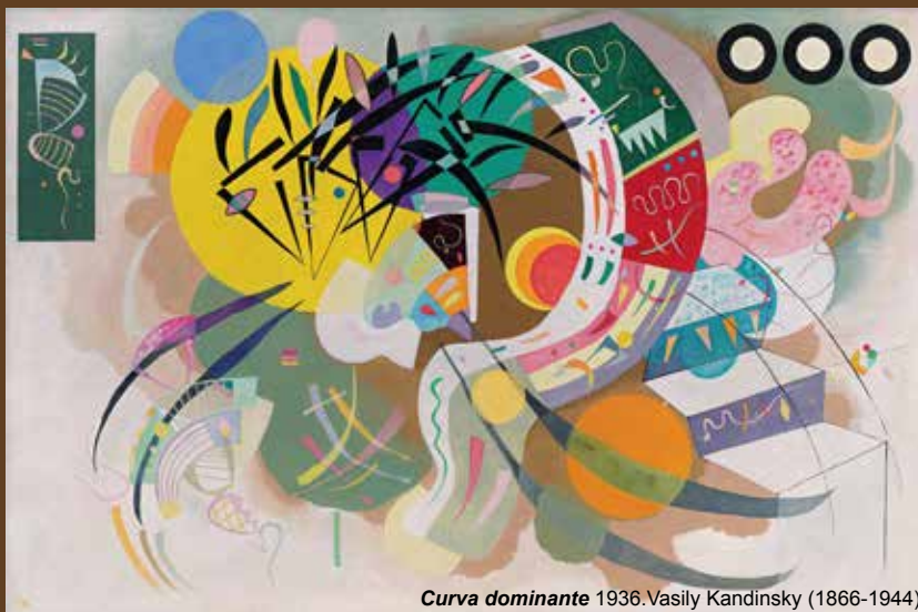
Curva dominante 1936. Vasily Kandinsky (1866-1944)

noviembre de 2017 - año 3 - www.jusmisiones.gov.ar/capacitacion