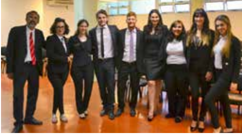
Equipo de Trabajo de Prensa y Ceremonial del Superior Tribunal de Justicia

Comenzamos el 2018 y reiteramos la invitación para el envío de fotografías de los equipos de trabajo y de los edificios donde funcionan las dependencias del Poder Judicial donde desarrollan sus tareas.