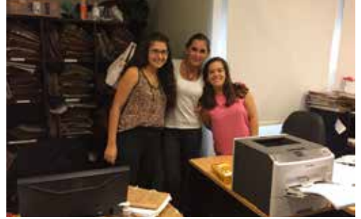
Equipo de Trabajo del Juzgado Civil 7