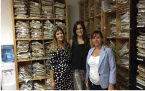
Equipo de Trabajo del Juzgado Civil 7