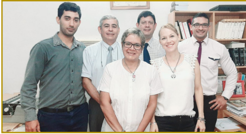
Equipo de Trabajo del Juzgado de Paz de Puerto Piray

Con el objetivo es conocer la organización a la cual pertenecemos y a las personas que forman parte de ella, los invitamos a enviarnos fotografías de los equipos de trabajo y de los edificios donde funcionan las dependencias del Poder Judicial donde desarrollan sus tareas.