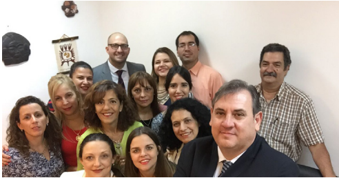
Equipo de Trabajo de la Dirección de Asuntos Jurídicos.