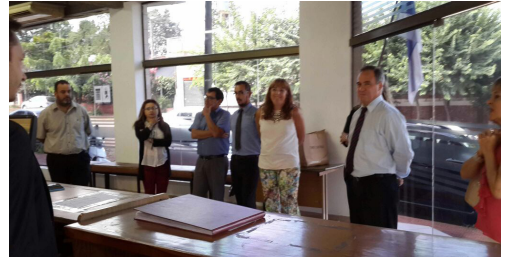
Equipo de Trabajo de los Juzgados: Civil 2 y Civil 3 de Oberá