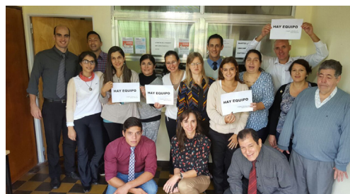
Equipo de trabajo del Juzgado Laboral Nro. 1 de Oberá