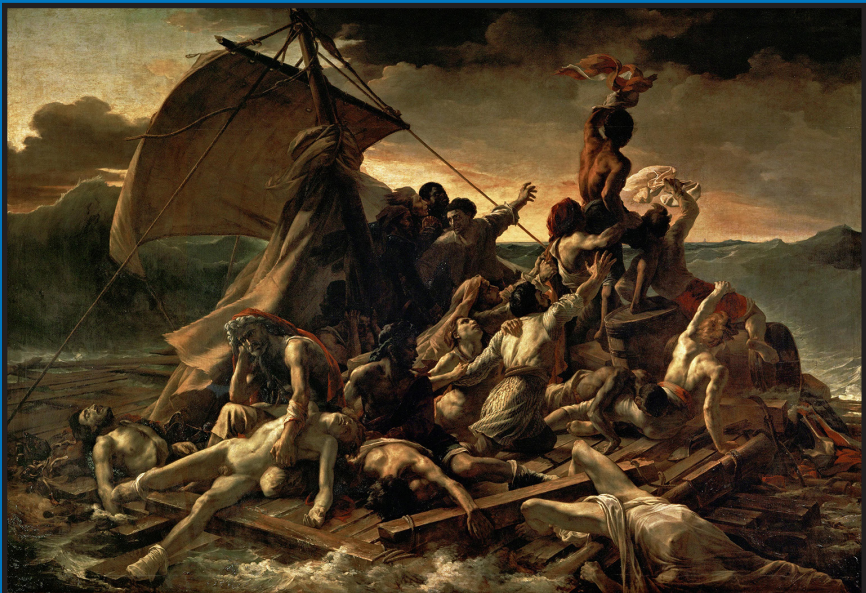
La balsa de la Medusa (1819). Jean-Louis André Théodore Géricault (1791-1824)

junio de 2017 - año 3 - www.jusmisiones.gov.ar/capacitacion