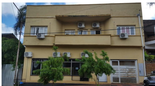
Edificio donde funciona el Juzgado Laboral Nro. 1 de Oberá.