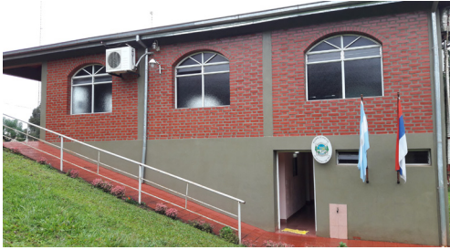
Edificio donde funciona el Juzgado de Paz de Caá Yari.