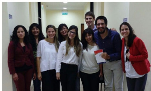
Equipo de Trabajo Juzgado de Paz de Itaembé Mini. Pdas.