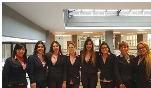
Equipo de Trabajo Juzgado Civil Nro. 5. Posadas

Inauguramos esta sección, con la idea de que cada equipo de trabajo, nos envíe imágenes grupales de todos los integrantes de la oficina, con el objetivo de conocernos y de afianzar el sentido de pertenencia a nuestro Poder Judicial ☐