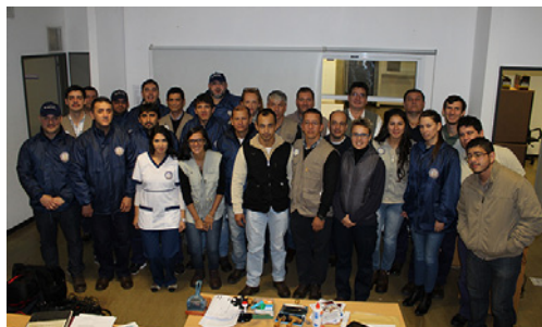
Equipo de Trabajo S.A.I.C. Posadas